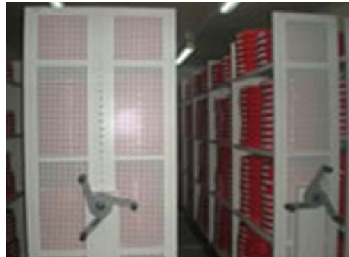
Modern depots for film tracks