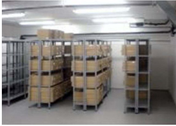
Depot for written and photo-documentation