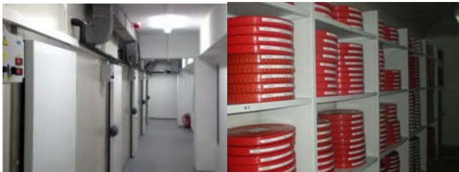
Depot for film

The Film archives (Department for protection, storage and processing of films and film materials) of the Cinematheque of Macedonia collects, protects, restores, catalogs and processes film material, produced mainly on film, but also on film tape. In the Film archive over 6,000 titles in 11,041 copies (films and documentation), or 44.363 rolls of footage from national and foreign production are deposited.