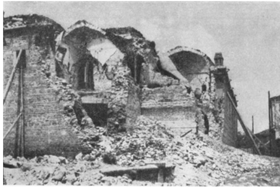
Последици од земјотресот во Скопје, 1963 година