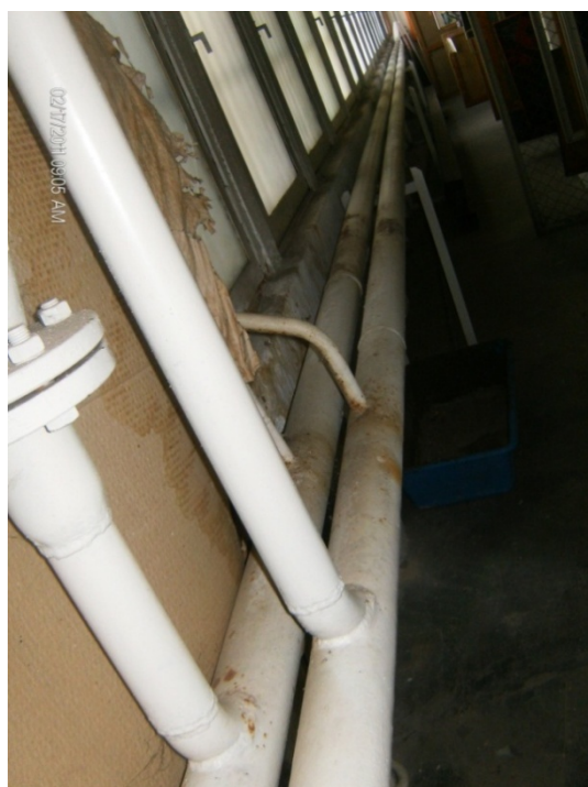
Водоводни, канализациски и цевки од парно затоплување

За да се одговори на поставените прашања доволно е да се погледнат приложените фотографии во депоа на некои музеите на Македонија.