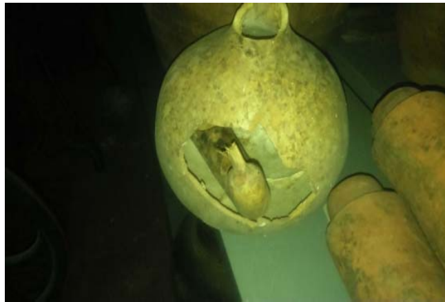
Последици од земјотресот во Скопје, септември 2016

Процена на нивото на ризик (UNESCO 2010:30).