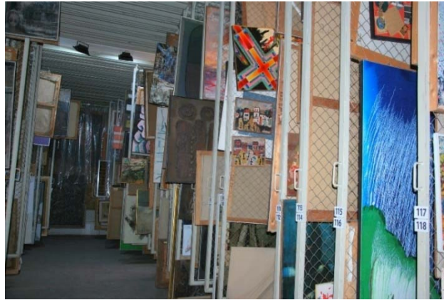
Депото на Музејот на современата уметност во Скопје, средено според методологијата RE-ORG, 2016.

моментов посебно внимание заслужува така наречената RE-ORG методологија, чии принципи бараат: обучен член на персоналот; водење основна документација; користење на просторот исклучително за колекциите; средените предмети да може да се пронајдат за 3 минути; секој предмет да биде подвижен без да оштети друг; и зградата да биде дизајнирана или адаптирана за заштита на колекциите (RE-ORG 2011:2).