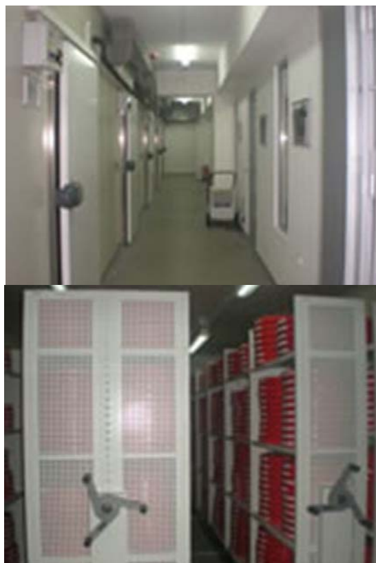
Современи депоа за филмска лента

Со реализацијата на овој проект, Кинотеката на Македонија стана центар за зачувување на богатиот аудиовизуелен материјал, а консеквентно и вистински пример за презентација и популаризација на нашето богато културно наследство.